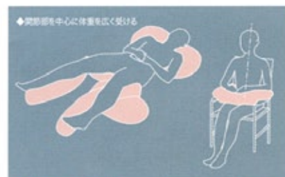
「アクティブポスチャーサポート」に対応